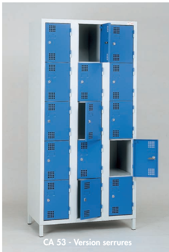
CA 53 - Version serrures

COLONNE LARGEUR 300 mm - COLONNE LARGEUR 400 mm