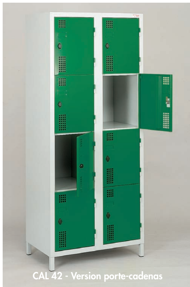
CAL 42 - Version porte-cadenas