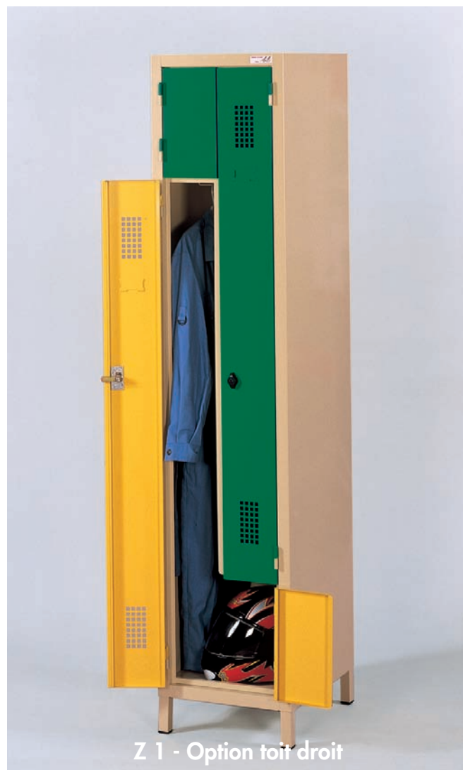
Z 1 - Option toit droit