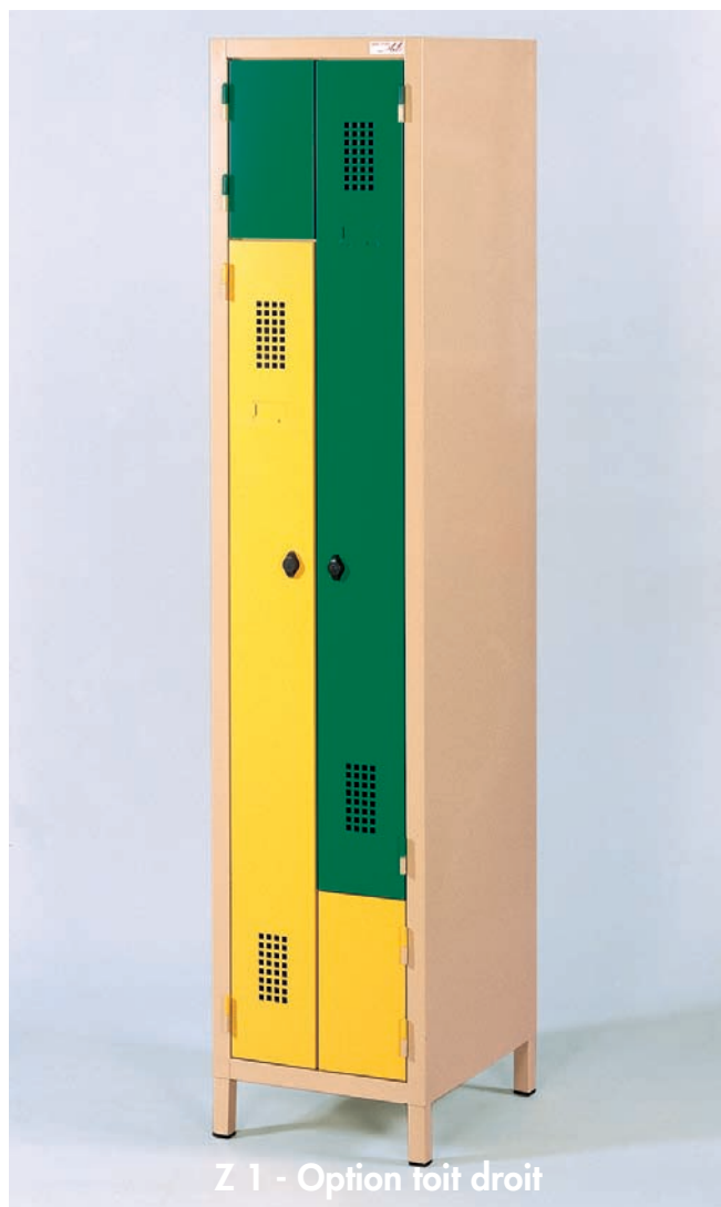
Z 1 - Option toit droit